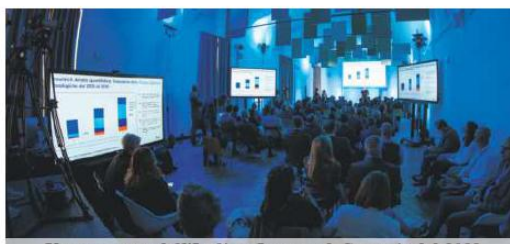
Un momento dell'Italian Insurtech Summit del 2022

Nel primo semestre del 2023 l'insurtech in Italia ha visto aumentare dell'85% la mole dei suoi investimenti e mantiene la prospettiva di arrivare entro il 2024 al tanto atteso traguardo di 1 miliardo di euro. Questi